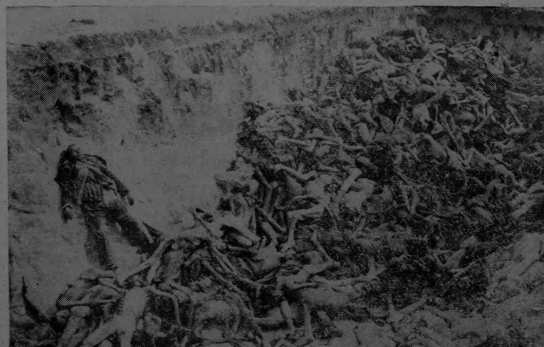
Una de las fosas comunes abiertas que hallaron las fuerzas aliadas cuando tomaron el campamento de concentración nazi de Belsen, en el que mensualmente perecían millares de cautivos, víctimas del hambre, las torturas y el asesinato brutal. Estos campamentos, diseminados por toda Alemania, son una revelación del sistema nazi, con todo lo que hay de bestial y de malvado en el ser humano, un sistema que ha destruido todo principio, toda fe y toda propia estimación en el Reich y que ha dejado a todo un pueblo en la más absoluta bancarrota moral.