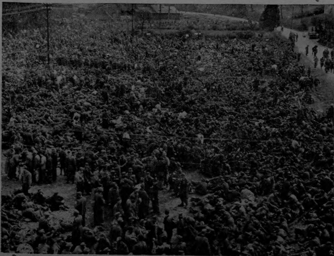
La foto muestra sólo una parte de los 317,000 alemanes apresados por el primer y noveno ejércitos de los Estados Unidos al copar la región del Ruhr, donde la táctica del General Eisenhower asestó a Alemania una de sus mayores derrotas militares de la guerra al ejecutarse brillantemente la maniobra de un inmenso cerco doble.